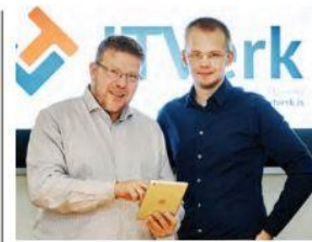
Hugbúnaðurinn heldur utan um öll gögn verkefna á einum stað sem vistað eru í skýinu.

„Hann segir engan vafa á því að hugbúnaðurinn feli í sér mikinn vinnusparnað. Nú fara öll gögn strax inn í kerfið og liggja allar upplýsingar á stafrænu formi miðlægt í skýinu. Allir ferlar eru jafnframt skýrari og komi upp vandamál er