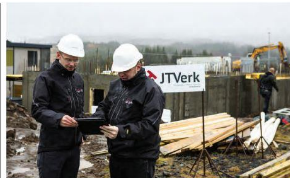
Stjórnendur JTVerk lögðu mikla vinnu í að finna rétta lausnina til að auka skipulag og skilvirkni á verkstað.

gæti íslenski byggingariðnaðurinn sparað í kringum 20-30 milljarða árlæga með notkun á miðlægum lausnum.